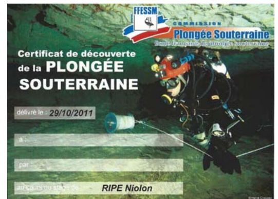
le certificat remis aux jeunes