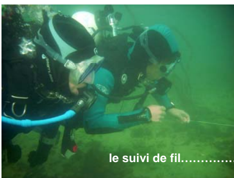
le suivi de fil..... dans le « tunnel »