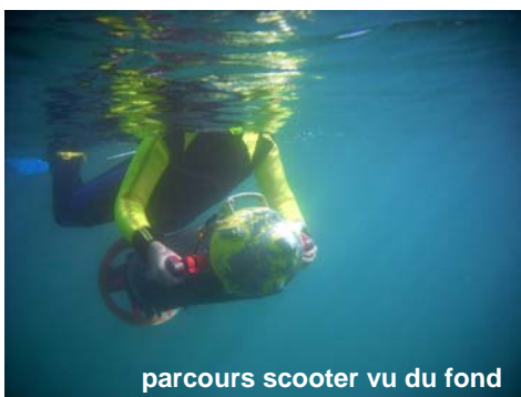
parcours scooter vu du fond