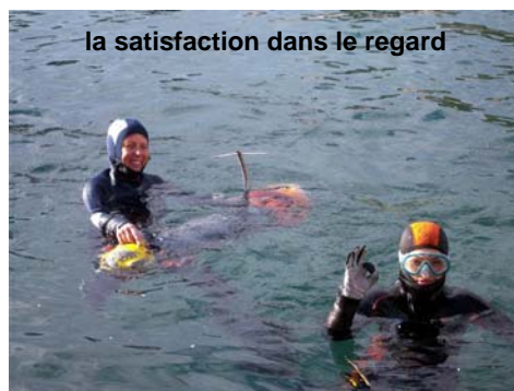
la satisfaction dans le regard

Le lendemain matin, la houle est plus forte que la veille, la pluie est au rendez-vous mais les activités sont toujours possibles dans le port de Niolon malgré les vagues qui montent parfois jusque sur le quai.