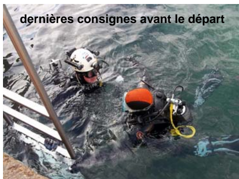
dernières consignes avant le départ

Après avoir reconditionné le matériel pour le lendemain, retour à Vacanciel pour un repas et une soirée conviviale suivie d'une nuit réparatrice car, mine de rien, la dénivellation du centre UCPA de Niolon est usante.