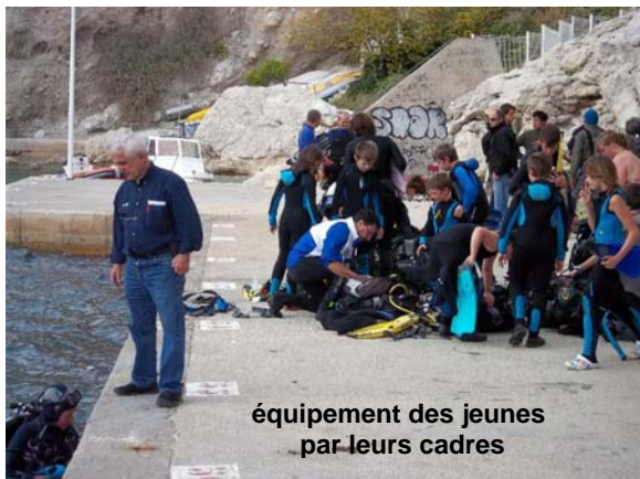
équipement des jeunes par leurs cadres

C'est 13 jeunes que nous accueillons pour cette première demi-journée et nous avons décidé, avec les collègues de l'Oriente, de faire, chacun notre tour, le briefing à l'ensemble du groupe avant de commencer les activités dans l'eau. Il s'avérera que cette solution nous fait perdre beaucoup de temps et, à partir du vendredi après-midi, nous ferons les briefings par demi-groupe.