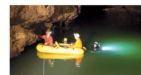
Le lac terminal du Trebiciano.