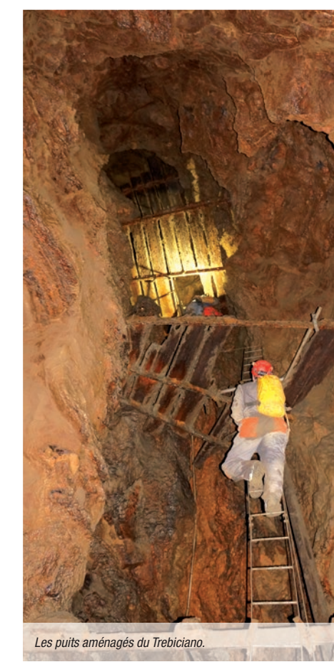
Les puits aménagés du Trebiciano.