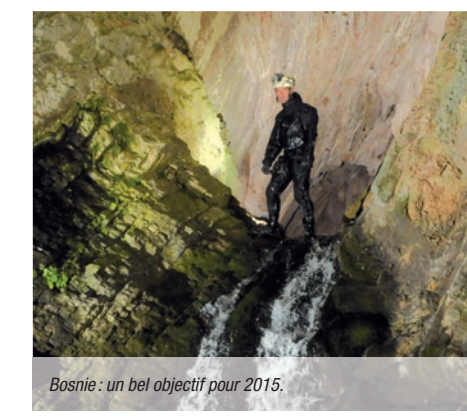
Bosnie: un bel objectif pour 2015.

Les crues violentes qui ont affecté les Balkans au printemps ont été largement relatées par la presse française. Et bien nous sommes en mesure de dire qu'en août il restait encore beaucoup (vraiment beaucoup) d'eau dans les rivières et dans les sources. Ce camp en deux temps, nord de la Bosnie puis région de Sarajevo au sud, a donc été dédié aux contacts avec les plongeurs et les spéléos locaux et à la prospection d'objectifs futurs. ■