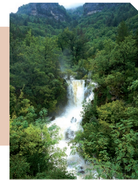
La « tranquille » source de Bez.